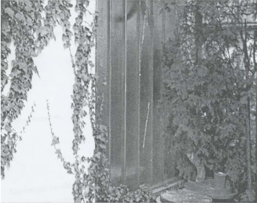
Durch den Steinwurf beschädigte Glasveranda